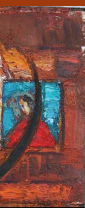
Natūrmortas ant sienos su paveikslėliais ir pjautuvu. 2016. Kartonas, aliejus. 30x45