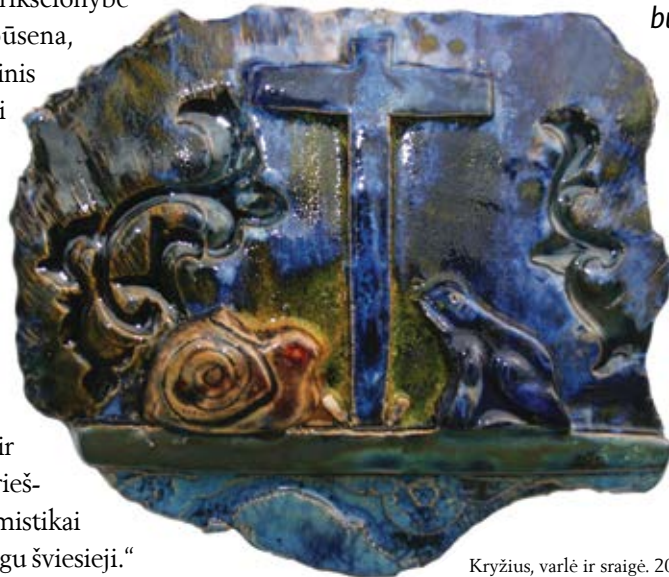
Kryžius, varlė ir sraigė. 2004. Keraminis reljefas, glazūros. 30x40

– Ir Vilniaus, ir Kauno parodai darbus rinkosi patys kuratoriai, ekspozicijos buvo skirtos Romo Kalantos atminimui, todėl meno pareikalavimas buvo iš ankstyvojo periodo. Sklando mitas, kad tai geriausias ciklas. Aš taip nemanau. Gerai būtų surengti didelę