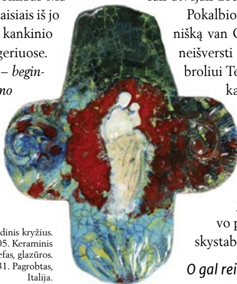
Kalėdinis kryžius. 2005. Keraminis reljefas, glazūros. 35x31. Pagrobtas, Italija.